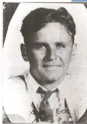
W.M. Branham (1909-1965)